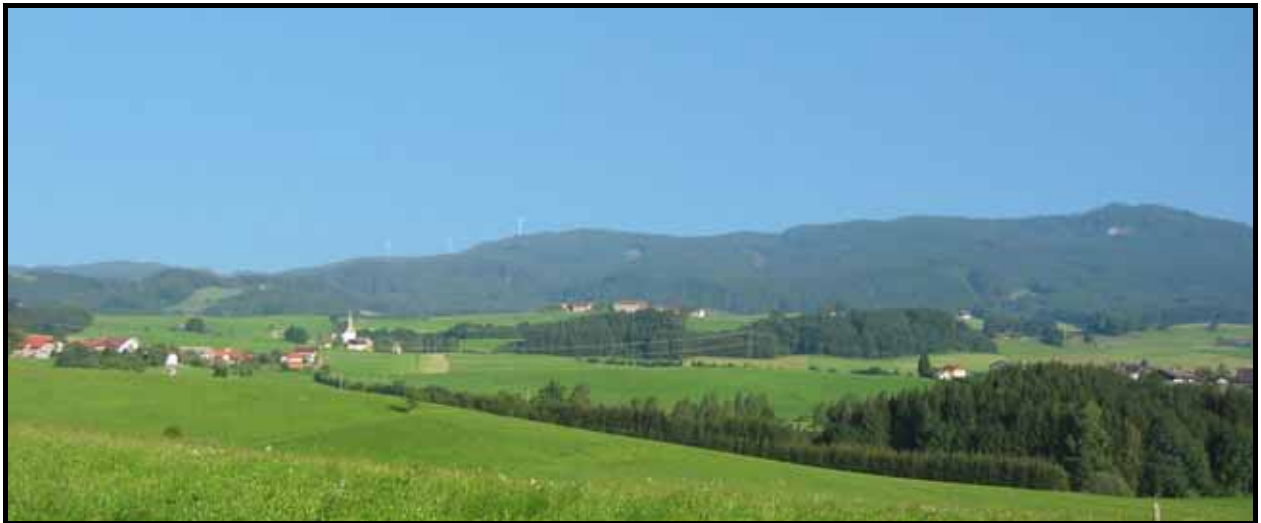
Projekteinreichung Juli 2003