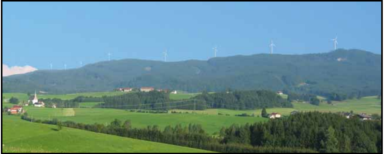
Projekteinreichung September 2002